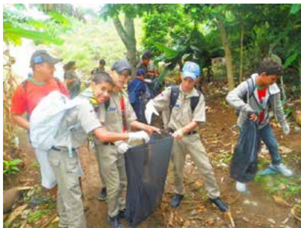
Figura 3 – Escoteiros do 44º/PE recolhem lixo no Brejo da Madre de Deus durante o 23º MutEco