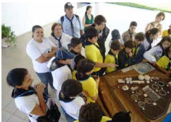
Figura 2 – 379º/SP visita ETE em Ribeirão Preto durante o 23º MutEco

Você também pode visitar uma Estação de Tratamento de Água (ETA), onde os profissionais poderão mostrar a sua tropa ou grupo as dificuldades que enfrentam para tratar a água que consumimos.