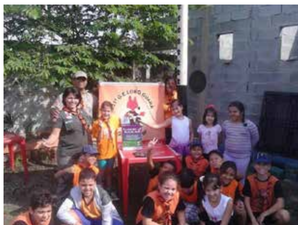
Figura 1 – GE 331º/SP participa da campanha "Doe seu celular" da Reciclecel durante o 23º MutEco

Em breve colocaremos mais informações sobre o Programa Limpa Brasil na página da Rede Ambiental Escoteira (RAE)*. Participe!