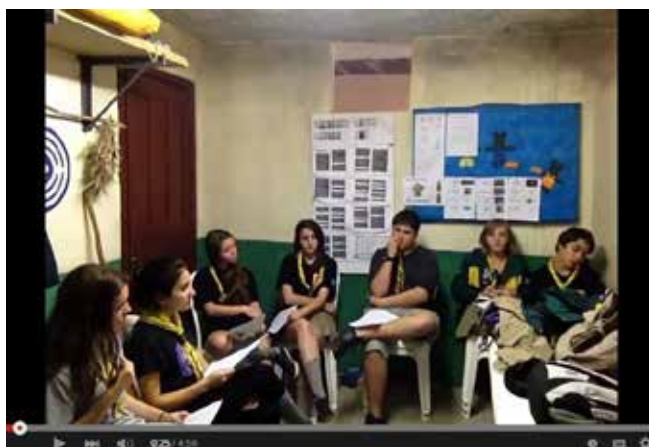
Figura 4 – Ramo Sênior do 121º/RS realizam debate sobre a Carta da Terra

GE do Ar América (58º/PR) GE Frei Leão Rodrigues (44º/MG) GE Guaranis (121º/RS) GE Jequitibá (25º/ES) GE Polaris (40º/SP) GE Rouxinol da Serra (275º/RS) GE São Carlos (251º/SP) GE Tibiquary (111º/RS)