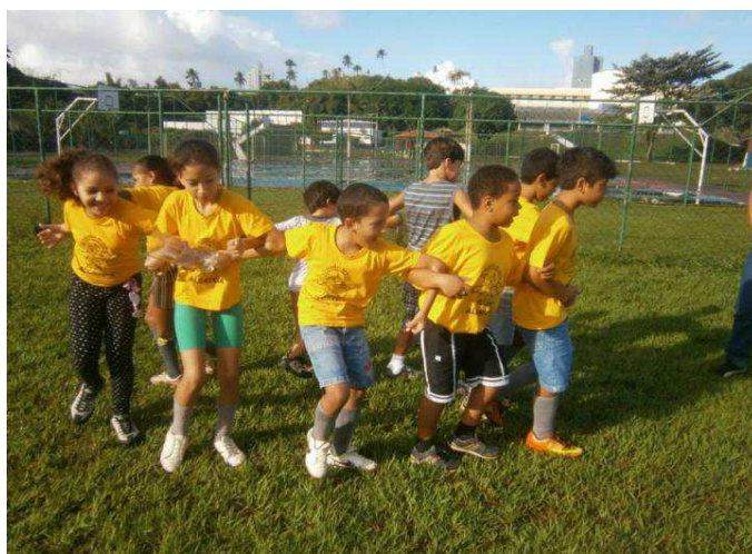
Figura 10 – Lobinhos do 33º./BA fazem o jogo do Aquamóvel em Salvador/BA