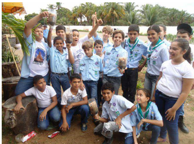
Figura 9 – Escoteiros do 6º./AL constroem purificadores artesanais de água