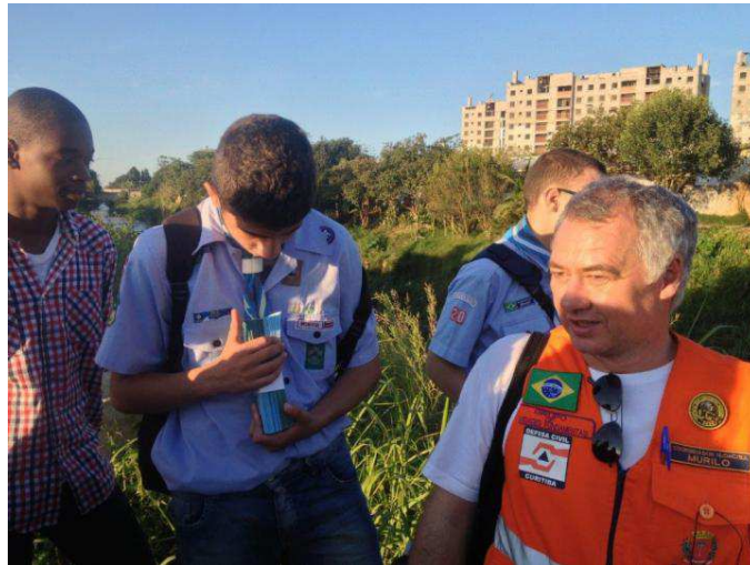
Figura 5 – 20º./PR realiza vistoria a áreas de risco em companhia da Defesa Civil de Curitiba/PR

Os Grupos Escoteiros interessados poderão realizar a atividade em conjunto com uma igreja da LDS mais próxima, no link https://www.lds.org/maps/?%C3%A7amg=por#ll=2.786725,-0.096159&z=6&m=google.road . As atividades realizadas em conjunto com a LDS dentro da data limite valerão como atividades do MutEco, para fins do Projeto Grupo Padrão.