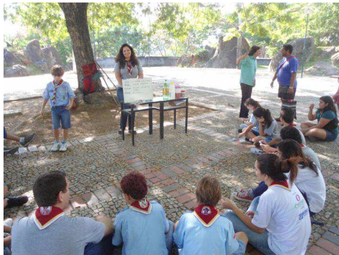
Figura 12 – Escoteiros do 33º./ES aprendem a fazer sabão a partir de óleo usado de cozinha