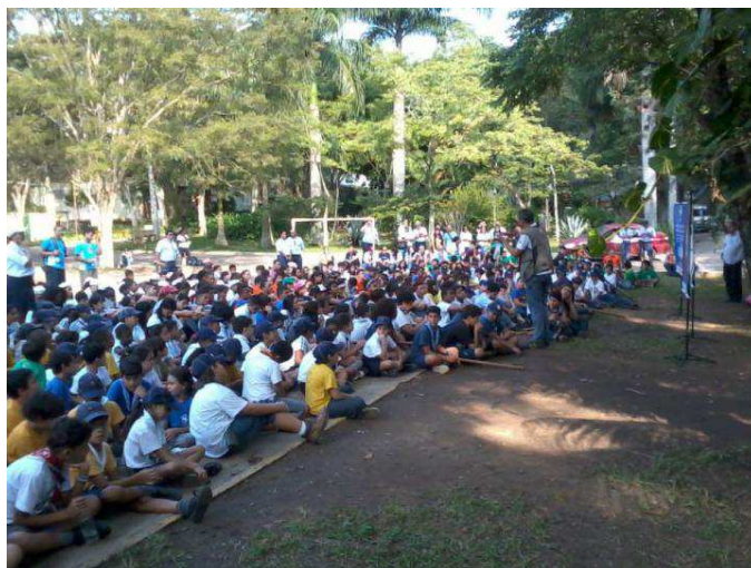
Figura 1 – Escoteiros do RJ assistem a palestra no Jardim Botânico (Horto) do Fonseca

O palestrante pode incentivar que os ouvintes façam perguntas, de modo que haja um pequeno debate ao final da palestra. Desta forma, vocês estarão cumprindo o objetivo da Parte A relativo ao tema da palestra, isto é, uma palestra sobre ar e água cumpre esse objetivo, e assim por diante.