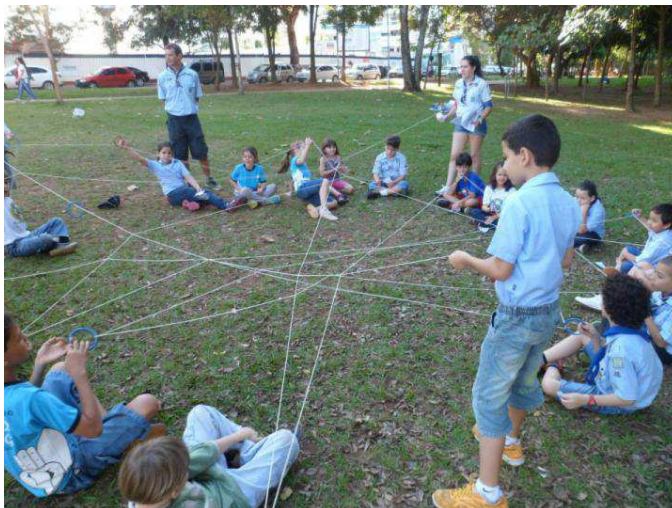
Figura 7 – Lobinhos do 9º./GO participam da dinâmica “teia da vida”

Que tal convidar as crianças (e mesmo os adultos !) que brincam nos parques a participar de uma dinâmica da IMMA? Este é um momento instrutivo, divertido e que difunde a consciência ambiental, além de ser um programa atrativo e “diferente” para quem não é escoteiro. Cada atividade, dinâmica ou jogo traz informações completas sobre o modo de fazer, o objetivo, etc.