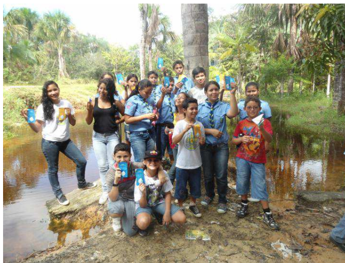
Figura 3 – 28º./AM realiza distribuição de alertas do XXII MutEco em Tefé/AM