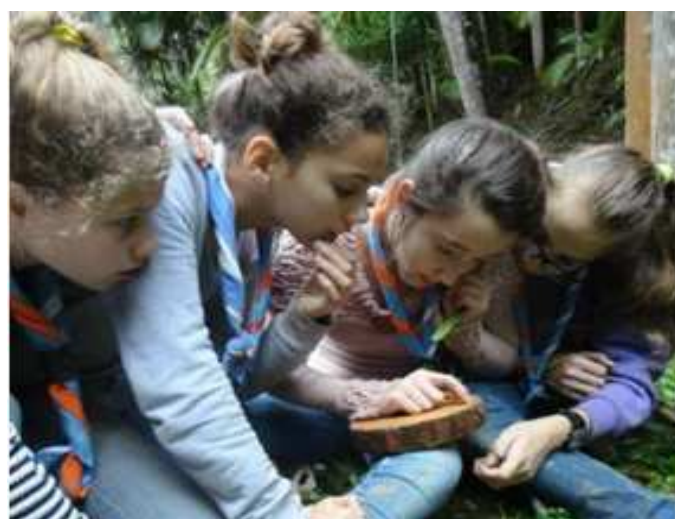
Figura 13 – Escoteiras do 33º./SC realizam a atividade “autobiografia de uma árvore”