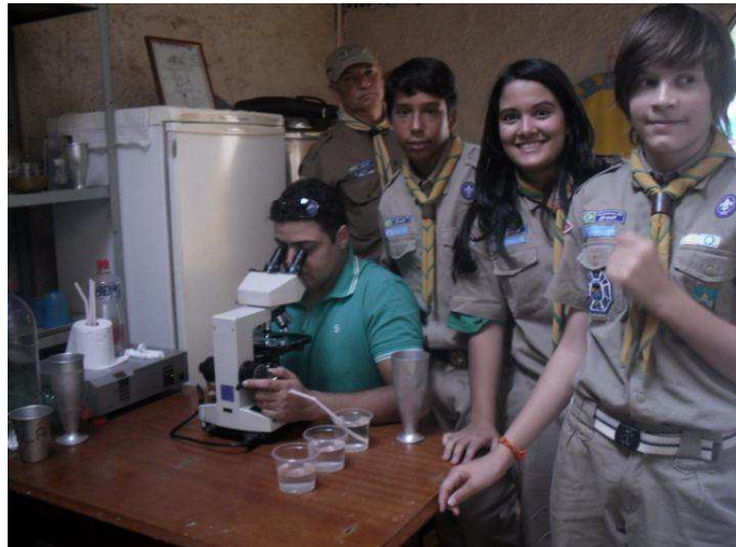
Figura 11 – Guias e sêniores do 2º./DF analisa amostras de água de cursos d'água da região