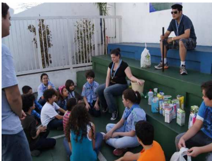
Figura 8 – Escoteiros do 10º./SP aprendem a fazer sabão reciclado