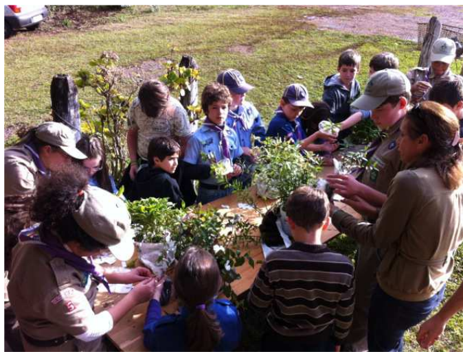
Figura 2 – Escoteiros e lobinhos do 5º./RS separam e acondicionam mudas de árvores nativas e ornamentais para serem distribuídas na abertura da 20ª Semana Municipal do Meio Ambiente de Sobradinho/RS