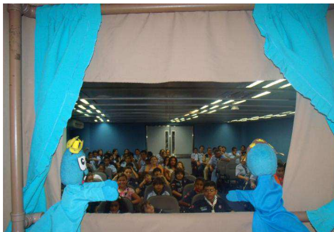
Figura 4 – 13º./CE assiste a peça de teatro de mamulengos realizada pela CAGECE (Companhia de Água e Esgoto do Ceará)

Uma boa opção é participar do projeto "Mãos que ajudam o meio ambiente", que está previsto para acontecer no dia 7 de junho em todo o Brasil, que é uma parceria da Igreja de Jesus Cristo dos Santos dos Últimos Dias (LDS) e os Escoteiros do Brasil.