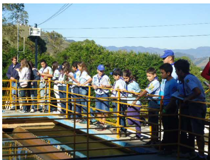
Figura 6 – 4º./MG visita Estação de Tratamento de Esgoto (ETE) em Itajubá

Visitar uma estação de tratamento de água (ETA) ou esgoto (ETE) é uma excelente oportunidade para que os jovens vejam o que é necessário fazer para que tenhamos água potável em casa e para manter os rios limpos, após usarmos essa água. Isto ajuda a formar a consciência ambiental dos jovens, para que no futuro eles saibam a importância de economizar água e também exijam do poder público investimentos na área de saneamento.